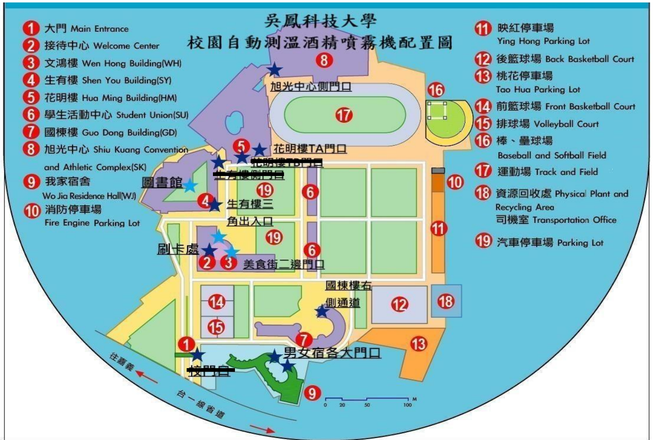
吳鳳科技大學校園自動測溫酒精噴霧機配置圖